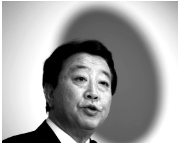
Yoshihiko Noda, de 54 anos, ocupava o Ministério das Finanças

Abbasi Davani também destacou que qualquer pedido deve ser feito por meio de canais oficiais. "Se não recebermos esses pedidos oficialmente, não podemos responder." No início do mês, graduados funcionários da AIEA visitaram instalações nucleares iranianas, dentre elas algumas onde o urânio é enriquecido. As informações são da Dow Jones.