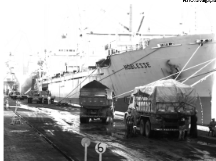
Foram 206.585 toneladas em apenas um mês, um incremento de 18,32%