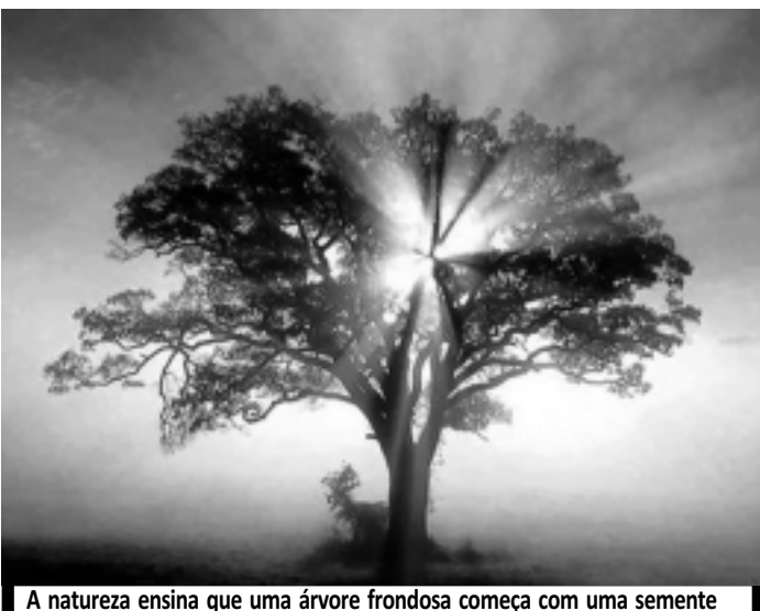
A natureza ensina que uma árvore frondosa começa com uma semente

E sabe qual é o prêmio da boa plantação no solo do tempo? A consciência tranquila.