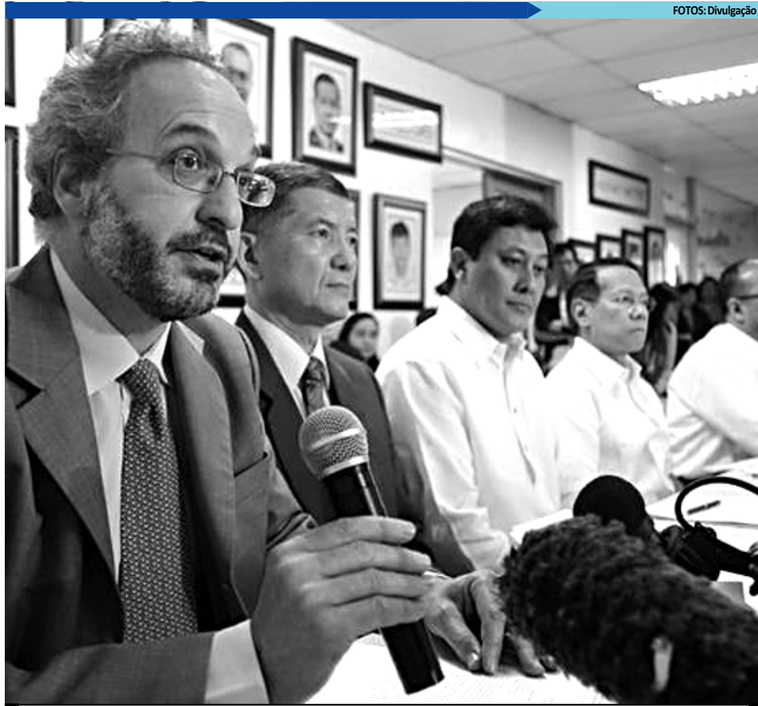
O veterinário-chefe da FAO, Juan Lubroth, pede mais prevenção e supervisão contra o vírus da gripe

aves e em populações de pássaros selvagens caiu de no pico de 4.000 para 302 em meados de 2008, mas desde então os surtos têm aumentado progressivamente, com cerca de 800 casos re-