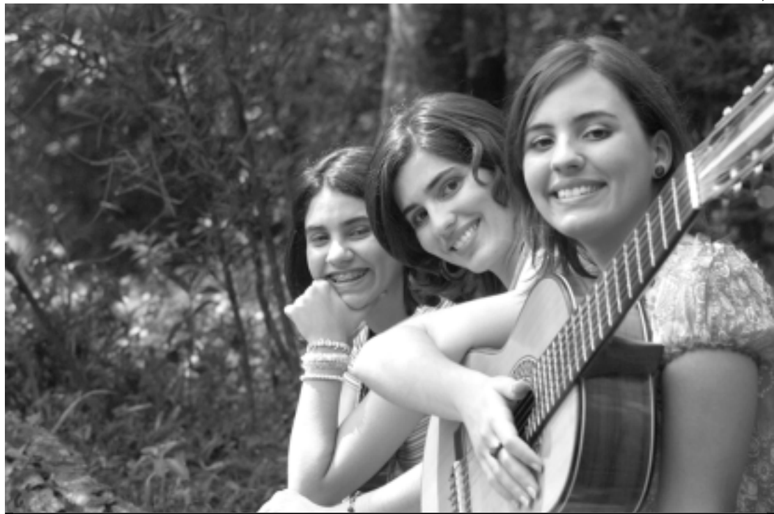
O grupo formado por três irmãs abre a temporada de shows na Praça Rio Branco com clássicos populares

"Para nós é uma grande honra participar do Sabadinho Bom, uma iniciativa da Fundação Cultural de João Pessoa que ajuda a democratizar o acesso à