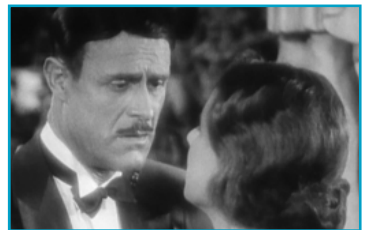
SESC EXIBE HOJE A IDADE DO OURO

#A banda Deep Purple, com mais de 100 milhões de discos vendidos, volta a se apresentar em São Paulo no dia 10 de outubro, na casa de shows Via Funchal. O quinteto dará uma boa geral em seus grandes sucessos, entre os quais a mitológica 'Smoke On The Water', além de mostrar canções de Rapture Of The Deep (2005), seu mais recente álbum de estúdio, que está sendo relançado em edição especial. O grupo vem com Ian Gillan (vocal), Roger Glover (baixo), Ian Paice (bateria), Steve Morse (guitarra) e Don Airey (teclados). Informações: 3846-2300.