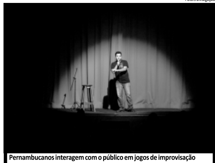
Pernambucanos interagem com o público em jogos de improvisação