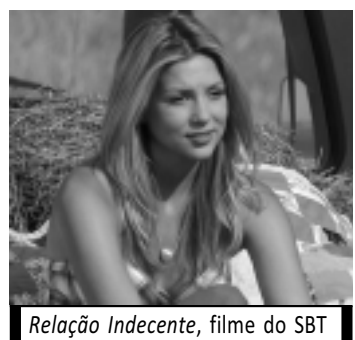
Relação Indecente, filme do SBT

14h30 - E Ai Doutor? 15h15 - Todo Mundo Odeia o Chris 16h45 - Tudo A Ver 19h15 - Jornal da Correo Edição da Noite 19h45 - Jornal da Record 20h30 - Novela: Rebelde 21h15 - Série: CSI - Investigação Criminal 22h00 - Novela: Vidas em Jogo 23h00 - A Fazenda 00h15 - Série: CSI Miami 01h15 - Programação IURD