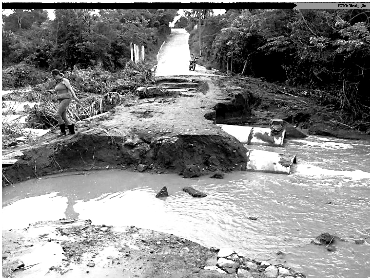
Cena dos estragos causados pela chuva em Lagoa Seca, onde parte da BR 104 foi destruída, em julho; o município receberá o mutirão em setembro

Ainda com o decreto, os órgãos do Sistema Nacional de Defesa Civil (Sindec) na Paraíba ficam autorizados a prestar apoio suplementar aos municípios afetados, devendo realizar prévia articulação com a Gerência Executiva de Defesa Civil do Estado. Este ano, 58 municípios paraibanos decretaram situação de emergência, sendo nove por estiagem e 49 por enxurradas e inundações. A média de prazo de validade dos decretos é de 90 dias, podendo ser renovada por mais 90 dias.