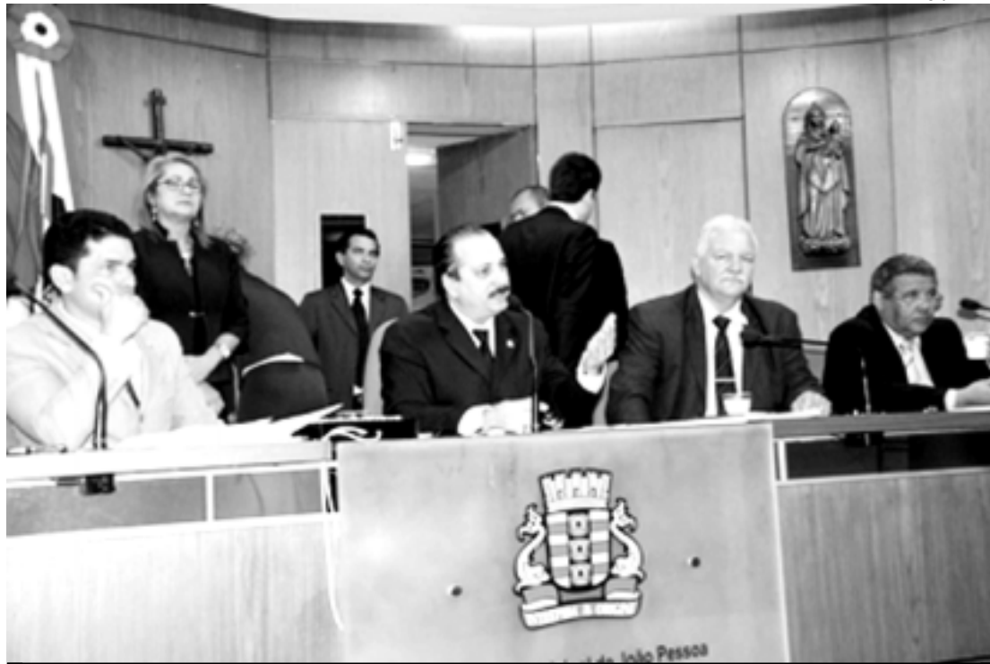
Vereadores de João Pessoa deverão exercer funções de fiscais no cumprimento da legislação vigente na cidade

O primeiro edital do Empreender-PB foi lançado em junho e vai beneficiar, inicialmente, as áreas de apicultura, atividade têxtil, mineração, pecuária e agricultura familiar. O primeiro edital disponibilizou R$ 5 milhões, com financiamentos de até R$ 500 mil para os negócios coletivos. O programa deve injetar de R$ 15 a R$ 20 milhões só este ano.