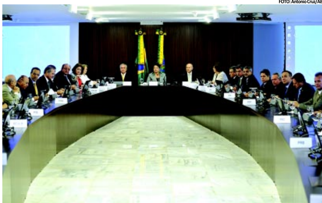
A presidente Dilma Rousseff coordena reunião do Conselho Político e apresenta diretrizes sobre nova Emenda

Para desconstrair o ambiente, ele fez até uma piada. Ao lembrar referência feita por Dilma de que era necessário um "emendão" para solucionar o problema da saúde, Temer foi mais longe. "Emenda 29 não dá. Precisamos é de uma emenda 58", brincou ele, dobrando o número 29.