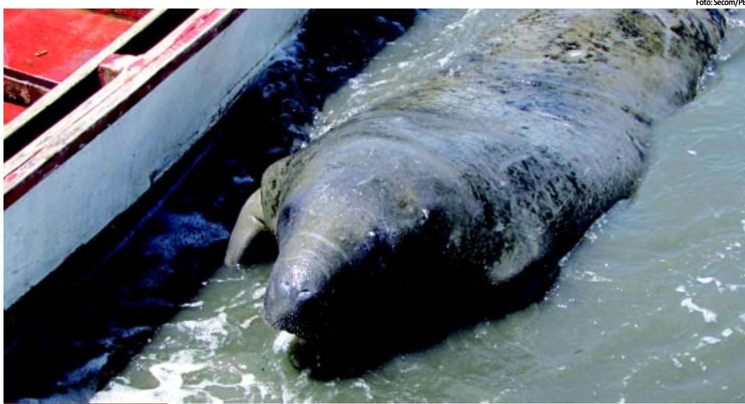
MEIO AMBIENTE | Sudema desencilha peixe-boi 'Arturzinho' em praia de Lucena PÁGINA 10

maior percentual do país de pessoas que fumam, seguido pelo Rio Grande do Sul. Os menores índices foram registrados no Amazonas. E o maior percentual de fumantes está na zona rural. PÁGINA 8