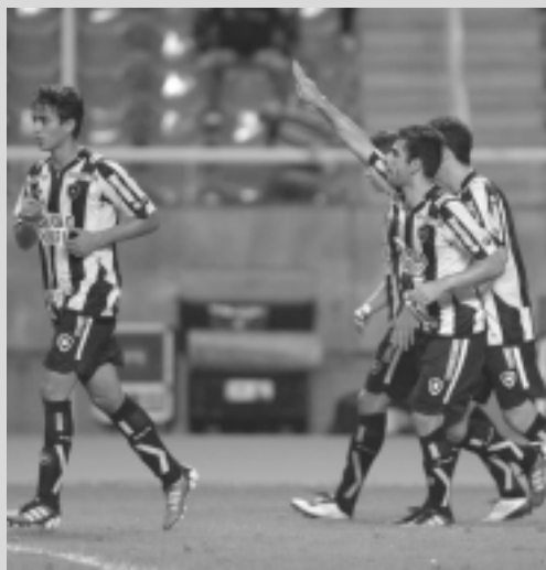
O Botafogo terminou o primeiro turno em quinto

Das sete edições em que participou no Brasileiro, o Botafogo teve em 2007 outro ano com bom retrospecto. Na ocasião, o time ter-