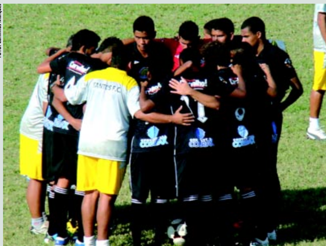
Jogadores e membros da comissão técnica do Santos reunidos antes do jogo decisivo contra o CSP