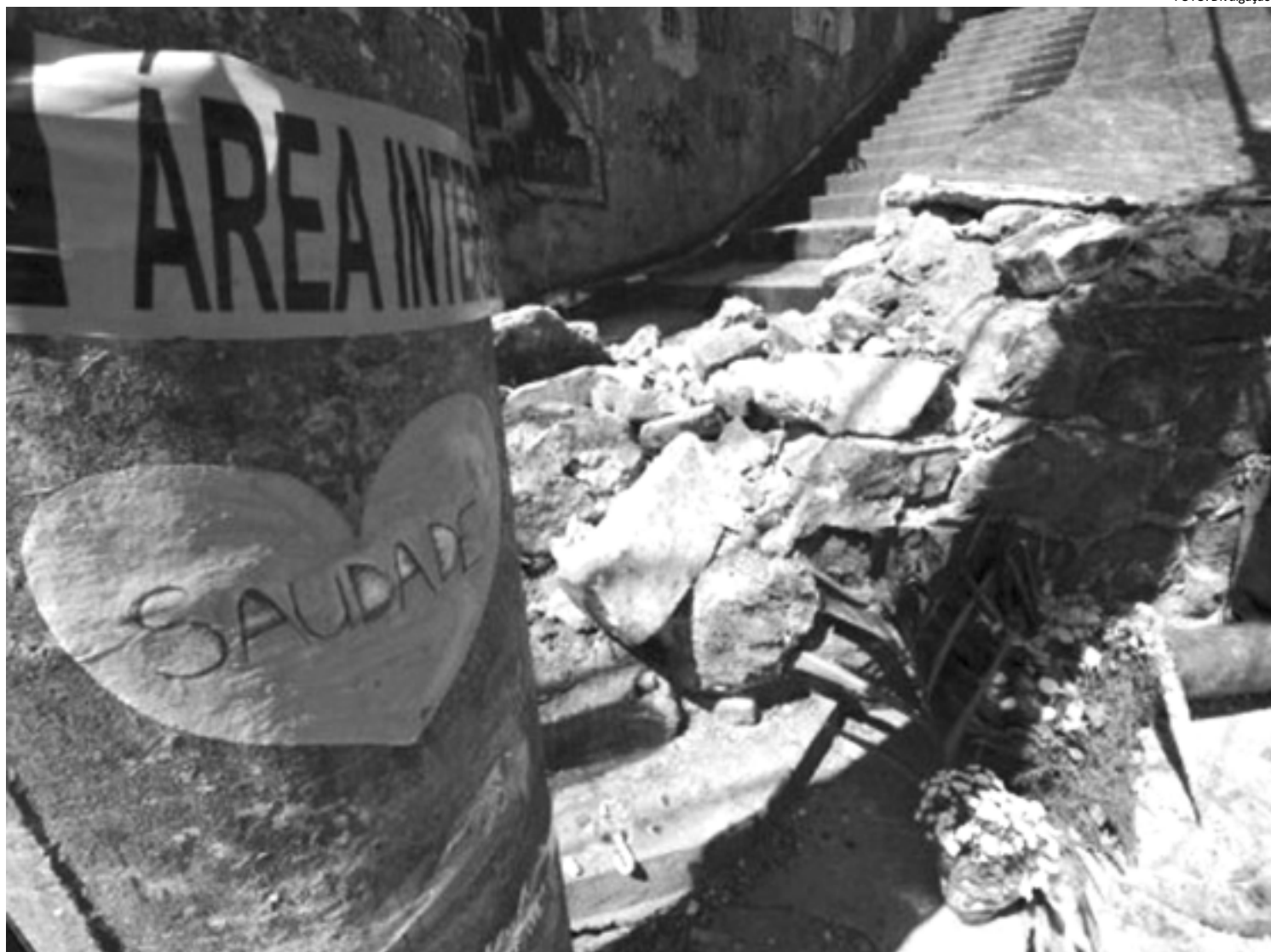
Ontem, o local onde ocorreu o acidente, em Santa Teresa, foi tomado por homenagens aos passageiros que morreram, no último sábado

Além disso, 786 pessoas foram presas em flagrante e 70 menores apreendidos.