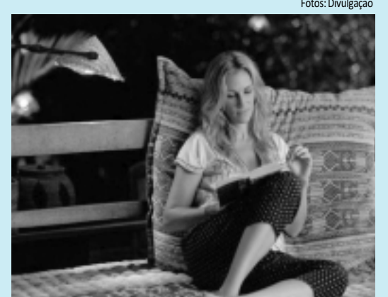
Julia Roberts numa cena de Comer, Rezar, Amar

>>> COMER, REZAR, AMAR - DMesmo bem-sucedida profissionalmente, Liz Gilbert sente-se confusa e percebe que precisa dar uma guinada em sua vida. Após um doloroso divórcio, ela parte em uma jornada ao redor do mundo. A viagem se transforma em uma busca por autoconhecimento. Na Itália ela descobre o prazer da gastronomia. Na Índia, Liz descobre o poder da oração e em Bali, a paz interior e um amor verdadeiro. SE LIGUE: Hoje, às 22h32, no HBO